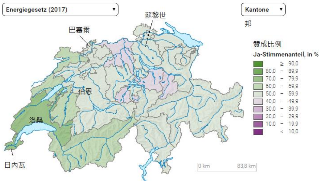
圖 3、瑞士能源法公投結果[12]

此次提案者，也是主要反對者的人民黨，為瑞士右翼民粹政黨，反對政府過度管制，重商輕環保監督、偏好核電，並希望限制移民、限制社會福利，其在近十年來成為瑞士國會下議院第一大黨。位於蘇黎士的民調公司 Tamedia 分析七個主要政黨支持者其公投傾向，發現其中五個政黨的支持者，均有七成以上比例投下贊成票；中間偏右的自由民主黨 (FDP)則有五成的比例贊成；但人民黨的支持者中，則僅有 26% 會投下贊成，可見政黨傾向為重要的影響投票因素。由於瑞士人民黨在德語區的支持度較高，反映在投票結果上，德語區的民眾投下贊成票的比例稍低 [14]。